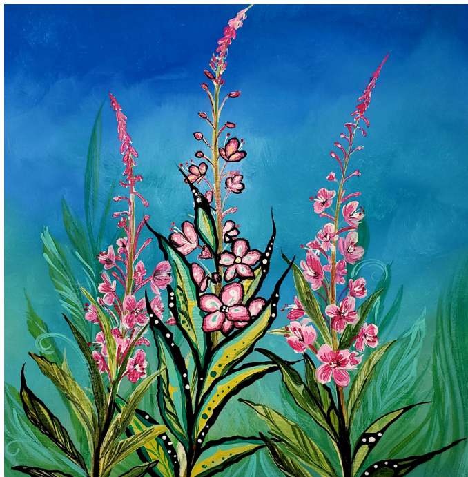
Illustration par Karen Erickson

Les frais d'hébergement et de déplacement doivent être couverts par votre organisme. Veuillez noter que le nombre de places est limité à 35 personnes, et que notre processus de sélection tiendra compte des objectifs en matière de diversité et d'inclusion.