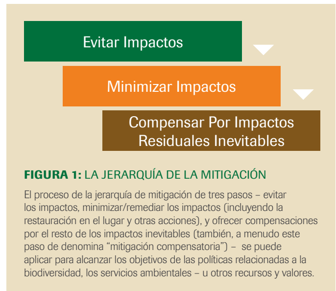
FIGURA 1: LA JERARQUÍA DE LA MITIGACIÓN

Dada la amplitud del trabajo de mitigación de TNC, es fundamental para TNC promover y operar mediante un conjunto básico de principios para la mitigación. Este documento resume 10 principios fundamentales para la aplicación de la jerarquía de mitigación (evitar, minimizar y compensar - Figura 1)